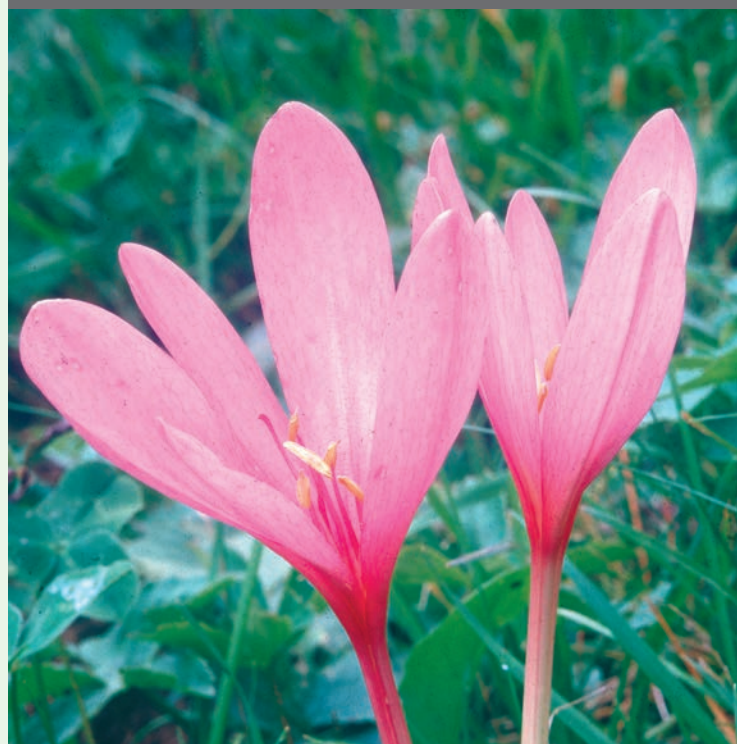
Blüte der Herbstzeitlose