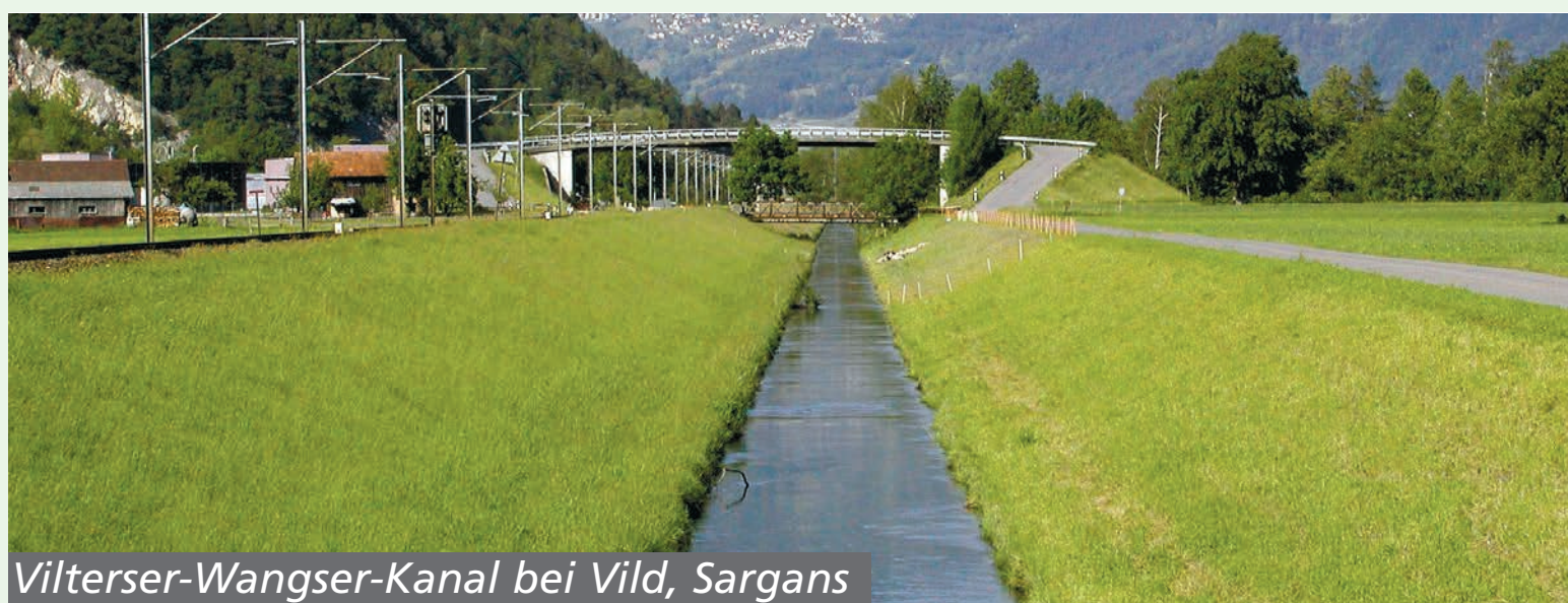
Vilterser-Wangser-Kanal bei Vild, Sargans

Entlang von Bächen und Gräben sind Kleinstrukturen besonders wichtig. Leider werden beim Gewässerunterhalt die Gebüsche immer wieder radikal entfernt. Hier sollte ein Umdenken stattfinden, denn eine lockere Bestockung steht nicht im Widerspruch zum Hochwasserschutz.